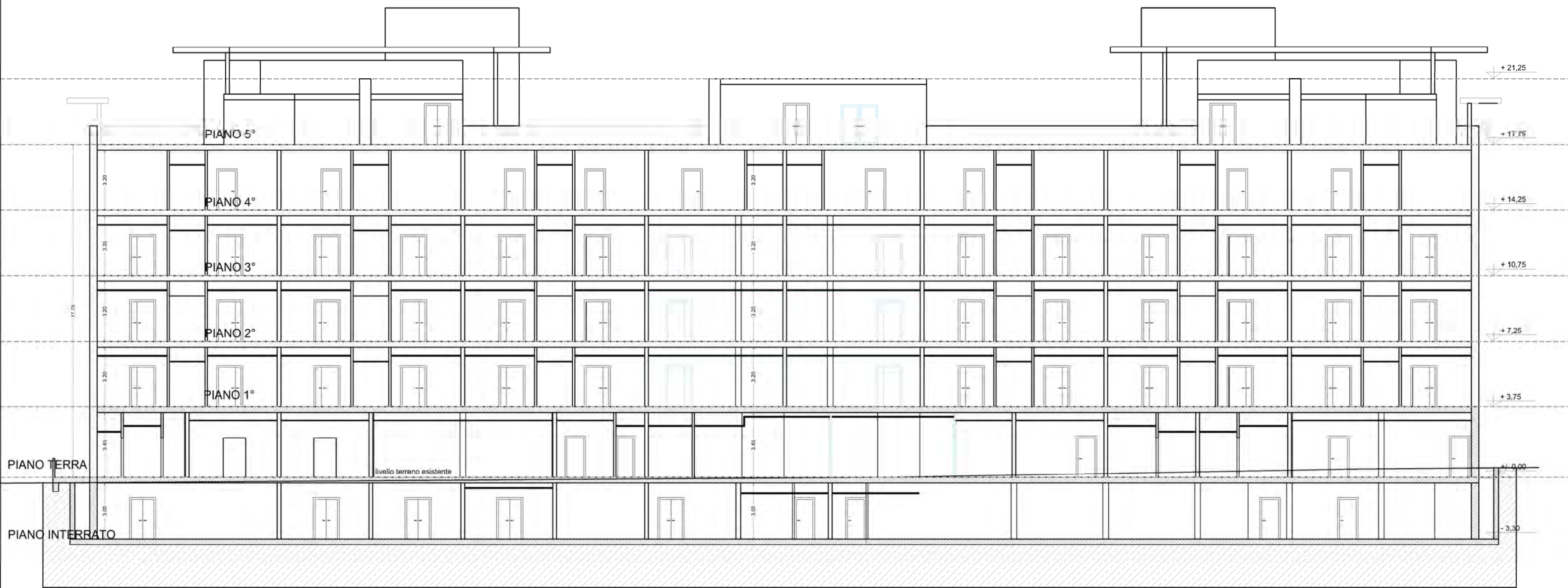
SEZIONE B - B'